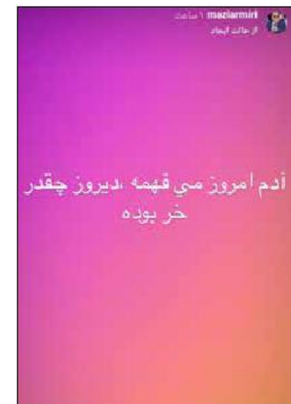
استوری مازیار میری از داوران جشنواره امسال؛ (احتمالا) در واکنش به صحبت‌های فرامرز قریبیان