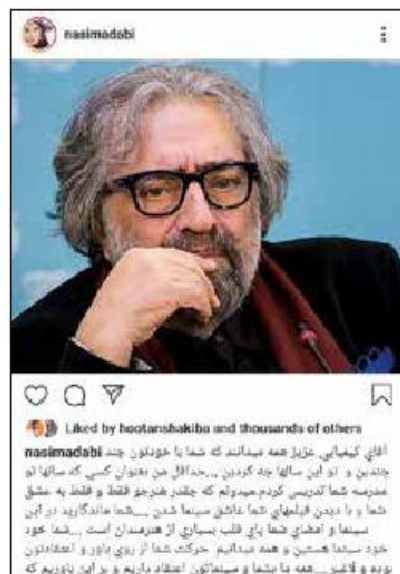
پست نسیم ادبی در واکنش به صحبت‌های شهاب حسینی و در حمایت از «مسعود کیمیایی»