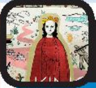
جنگ غذاروی صحنه «کینگ جان»

مهر: «برچار دشتگردل مرده‌است، برادر او جان پادشاه انگلستان است. تهدید و محسبه در برابر اروپا حتی از سوی اشراف انگلستان و نزدیک‌ترین اعضای خانواده‌اش دیده می‌شود. کینگ جان راهی برای بالانگه داشتن تاج پادشاهی خود ندارد.» روایت بالابخشی از موضوع نمایش «کینگ جان» اثر ویلیام شکسپیر است که کمپانی رویال شکسپیر انگلستان قصد دارد در جدیدترین تولید خود، این نمایش را با کارگردانی الینور رود روی صحنه ببرد. نکته جالب توجه این است که کمپانی به مخاطبان خود درباره خرید صندلی‌های ردیف‌های جلوی سالن میرزاان اجرای «کینگ جان» هشدار داده است. هشدار داده‌شده به مخاطبان از این قرار است: «لطفاً نگاه نکنند که اجرای این نمایش شامل جنگ غذا روی صحنه است و اگر شما در صندلی ردیف‌های جلوی سالن نشست باشید، راه فراری از این اتفاق نخواهد داشت.» نمایشنامه «کینگ جان» اثر شکسپیر موضوع مسیحه‌های سبیلی در دوران پادشاهی جان در انگلستان است؛ دوره‌ای که انگلستان بخش اعظمی از فرانسه را در تصرف خود داشت.