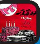
فایشگاهی از تبلیغات دهه‌های ۳۰ تا ۵۰