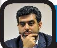
تلاش برای تأسیس انجمن‌های صنفی در آموزش هنر

مهر: «برچار دشتگردل مرده‌است، برادر او جان پادشاه انگلستان است. تهدید و محسبه در برابر اروپا حتی از سوی اشراف انگلستان و نزدیک‌ترین اعضای خانواده‌اش دیده می‌شود. کینگ جان راهی برای بالانگه داشتن تاج پادشاهی خود ندارد.» روایت بالابخشی از موضوع نمایش «کینگ جان» اثر ویلیام شکسپیر است که کمپانی رویال شکسپیر انگلستان قصد دارد در جدیدترین تولید خود، این نمایش را با کارگردانی الینور رود روی صحنه ببرد. نکته جالب توجه این است که کمپانی به مخاطبان خود درباره خرید صندلی‌های ردیف‌های جلوی سالن میرزاان اجرای «کینگ جان» هشدار داده است. هشدار داده‌شده به مخاطبان از این قرار است: «لطفاً نگاه نکنند که اجرای این نمایش شامل جنگ غذا روی صحنه است و اگر شما در صندلی ردیف‌های جلوی سالن نشست باشید، راه فراری از این اتفاق نخواهد داشت.» نمایشنامه «کینگ جان» اثر شکسپیر موضوع مسیحه‌های سبیلی در دوران پادشاهی جان در انگلستان است؛ دوره‌ای که انگلستان بخش اعظمی از فرانسه را در تصرف خود داشت.