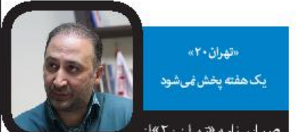
«تهران ۲۰» یک هفته پخش می شود