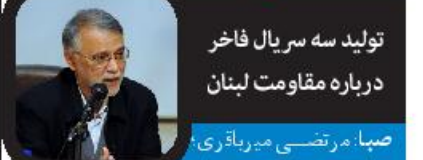
تولید سه سریال فاخر درباره مقاومت لبنان