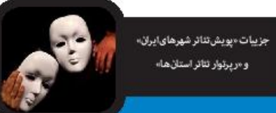
جزئیات «پوش تئاتر شهرهای ایران» و «پرئوتاز تئاتر استان‌ها»

فارس: اختلالات چند روز گذشته بخش فیبا و سبلیت کتابخانه ملی مشکلاتی را برای ناشران و مرتبطان با کتاب ایجاد کرده است. به تکی که روزهای پنجشنبه و جمعه هفته جاری کلا این بخش غیرفعال شده بود. بر اساس این گزارش، روبرو به بخش فیبا و اختلالات سایت، موجب گلایه‌هایی شده و مسیر ثبت و درخواست فیبا را با کندی همراه کرده است. از این رو با سرپرست اداره کل زیرساخت‌ها و پشتیبانی فنی کتابخانه ملی گفت‌وگویی صورت گرفت تا چارچوب این اختلال و زمان رفع آن اطلاع‌رسانی شود. باقی اعلام کرد: در اداره کل زیرساخت‌ها و پشتیبانی فنی شاهد تغییرات زیرساختی و نرم‌افزاری هستیم؛ چرا که حجم دیتابیس افزایش یافته بود. او در توضیح بیشتر روند کنونی ابراز داشت: تغییرات زیرساختی در طول هفته انجام نمی‌شود و امکان خاموش کردن رایانه در طول هفته وجود ندارد؛ زیرا تمام موارد در خط صورت می‌گیرد. اما برای خاموش کردن رایانه مرکزی و جابه‌جایی معمولاً آخر هفته این اقدامات انجام می‌شود. باقی تصریح کرد: روند و با تأکید بر این که تا ۱۰ روز آتی تمام مشکلات و کندی و قطعی سیستم رایانه‌ای از بین خواهد رفت. گفت: ۵ درصد تغییر در زیرساخت‌ها به پایان رسیده و تا ۱۰ روز آینده تمام زیرساخت‌ها به روز خواهد شد. هم‌تغییر زیرساختی داریم و هم نرم‌افزاری، به این دلیل که توسعه این سیستم یکباره و تحت وب است. اختلالی را شاهد بودیم. او در پایان اظهار خاطر داد: تا ۱۰ روز آتی تمام مشکلات و اختلالات سایت فیبا برطرف شود.