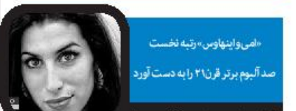
امی و اینهاوس «رتبه نخست صد آلبوم برتر قرن ۲۱ را به دست آورد

ایلتنا: روزنامه «گار دین» فهرست صد آلبوم برتر موسیقی قرن ۲۱ را به انتخاب نویسندگان خود در حالی منتشر کرده است که آلبوم «بازگشت به سیاهی» اثر امی و اینهاوس در رده نخست قرار دارد. «بازگشت به سیاهی» در پنجاهمین دوره جایزه گرمی، رنده پنج جایزه شد. ترانه این اثر را خود «اینهاوس» برده است. این اثر سومین تک‌آهنگ از دومین و آخرین آلبوم استودیویی امی و اینهاوس با همین نام بود. آلبوم دیگری از این خواننده با نام «فرانگ» در رده ۵۷ در فهرست دیده می‌شود. اما اثر «آینه» اثر گروه «راک د لستر و کز» در رده دوم و آلبوم «فلتری پیچیده تره زبانی من» اثر کلیه وست رید مشهور در رده سوم این فهرست قرار دارند. «پروانه» اثر کندی ریک لامار و «آوای نقره» اثر ال سی دی سائونسیست نیز به ترتیب چهارمین و پنجمین آلبوم برتر قرن ۲۱ به انتخاب گاردین هستند. آلبوم «پلنسه» به خوانندگی بیلسه هم در میان ۱۰ آلبوم برتر حضور دارد و جایگاه نهم را به خود اختصاص داده است. نام همسرا، جی‌زی نیز با آلبوم «باوریت» که رتبه بی‌ام‌را به خود اختصاص داده، در فهرست صدتایی گاردین دیده می‌شود.