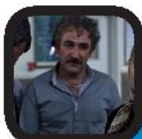
سالم صلواتی «بدران» را جلوی دوربین برد

به مناسب هشتادسالگی این شخصیت محبوب روی ساختمان های مشهور شهرهای مختلف به نمایش درآمد. این یک شوخی نیست و این نماد که به وسیله نور و سایه درست شده بود، شبیه شب در بیش از ۱۳ شهر به نمایش گذاشته شد و یک جشن سالانه منحصر به فرد را برای این شخصیت رقم زد. این نوع علامت در فیلم سینمایی «شوالیه تاریکی» به کارگردانی کریستوفر نولان که کریستین بیل نقش «بتمن» را بازی کرده بود، استفاده شد. کمیته دی سی هم برنامه های ویژه ای برای این شخصیت ضدتهدیه کاری داشت. این جشن سالانه از ملبورن در کشور استرالیا شروع شد. ۱۳ شهر دیگر مثل توکیو، برلین، پاریس، لندن، مونترال، سائو پائولو و یوهانسبورگ این نماد را به نمایش گذاشتند.