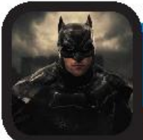
نمایش جهانی «بتمن» به مناسبت هشتادسالگی این شخصیت

دیوید مورل نویسنده آمریکایی به فیلم «آخرین خون» با بازی سیلوستر استالونه واکش نشان داد او نویسنده کتاب «اولین خون» است که در سال ۱۹۷۲ منتشر شد و برای اولین بار شخصیت «رمبو» را معرفی کرده؛ شخصیتی که با بازی سیلوستر استالونه به شهرت رسید. جدیدترین قسمت این فیلم که با عنوان «آخرین خون» به تازگی اکران شده امتیازات پابسی را از سوی منتقدان دریافت کرده است و خالق این شخصیت نیز با این نظرات موافق است. این نویسنده در ابتدا بسیار خود را مشتاق ساختن قسمت پنجم فیلم «رمبو» اعلام و پیش از این انتشار بارها از این فیلم یاد کرده بود. امیس از دبیر فیلم سیلوستر استالونه اعلام کرد: این فیلم فراتر از فنتری است و منتقدان حق داشتند امتیاز پابسی به این فیلم بدهند. او همچنین گفت: این فیلم اقتضاح است از این که نام من در بین کسانی که این فیلم را ساخته اند، دیده می شود احساس شرمساری می کنم. گفتنی است امتیازاتی که تا روز گذشته به این فیلم داده شده، ۳۱ درصد از ۸۴ درصد از ۷۵۷ مخاطب است امتیاز این فیلم از نگاه سینما سکر نیز ۸ در نظر گرفته شده است. در سایت IMDb نیز از ۲۶۱۱ مخاطبی که به این فیلم رای داده اند، امتیاز ۷.۲ از ۱۰ را دریافت کرده که به نظرمی رسد مورد علاقه مخاطبان بوده است. چهار فیلم منتشر شده از این مجموعه سینمایی تاکنون ۱۷۲ میلیون دلار فروش داشته اند.