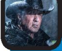
خلاق شخصیت «رمبو» از فیلم جدید استالونه منتشر است