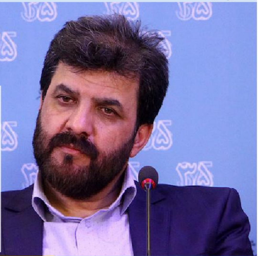
چهارمین حضور بین‌المللی