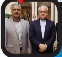
مدیران کل معاونت ارزشیابی و نظارت