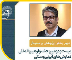
دبیر بخش پژوهش و سمینار بیست و دومین جشنواره بین‌المللی نمایش‌های آئینی و سنتی

در متن این حکم که به اهمیت تقویت جنبه‌های علمی و پژوهشی جشنواره اشاره دارد، تأکید شده است که با بهره‌گیری از ظرفیت‌های علمی اساتید و هنرمندان مجرب داخلی و خارجی، بخش پژوهش و سمینار بتواند سمینارهای شایسته، مؤثر و تخصصی برگزار کند و به ارتقای سطح علمی جشنواره کمک کند. سیاوش ستاری در این حکم ابراز امیدواری کرده که انتصاب گله‌دارزاده نقطه‌عطفی در شناخت دقیق‌تر و عمیق‌تر رشته‌ها و گونه‌های گوناگون نمایش‌های ایرانی و آئینی باشد و زمینه را برای گسترش پژوهش‌های تخصصی در این حوزه فراهم آورد. بیست و دومین جشنواره بین‌المللی نمایش‌های آئینی و سنتی، که از ۱۰ مرداد تا ۱۸ مهر در تهران و سایر استان‌ها برگزار می‌شود، همچون دوره‌های گذشته میزبان پژوهشگران، اساتید و هنرمندان داخلی و خارجی خواهد بود.