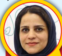
مریم باقری بازیگر:

امیر پارسی، بازیگر محبوب تلویزیون که با بازی در ماجراهای «عبدلی و اوستا» و ایفای نقش امیرزا یا اوستای خسیس عبدلی به شهرت رسید در شهر فرنگ ایفاگر نقش آقارحیم بقایی است که خیلی دنبال صرفه جویی آب، برق و گاز است و در واقع در اداره و در منزل سفارش به صرفه جویی می کند. وی درباره این برنامه گفت: کارتن رادیویی خیلی متفاوت است؛ چرا که طنزپرداز باید ذائقه مخاطبش را بشناسد، دوم این که حس پشت کارش باشد چیزهایی را که می گوید به دل مخاطب بنشیند.