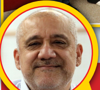
سینا نیکوکار بازیگر: