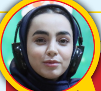
مریم خادم پور بازیگر: