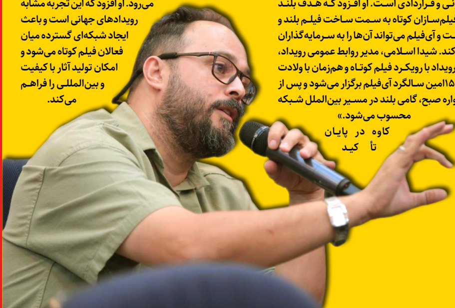
کاوه در پایان تأکید

کرد که پیچینگ آی فیلم فرصتی ارزشمند برای ارتباط مستقیم تولیدکنندگان و سرمایه‌گذاران است و فرهنگ‌سازی برای ارائه و شنیدن آثار خلاقانه، بخش مهم این رویداد به شمار می‌رود. او افزود که این تجربه مشابه رویدادهای جهانی است و باعث ایجاد شبکه‌ای گسترده میان فعالان فیلم کوتاه می‌شود و امکان تولید آثار با کیفیت و بین‌المللی را فراهم می‌کند.