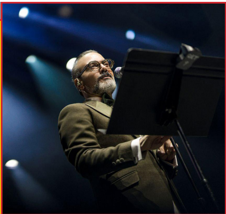
اوپرا هاوز ونکوور، تئاتر دولویل در پاریس، رئیس هال در لس‌آنجلس، گلبنکیان هال در لیسبون، گیدئون کنسرت هال در وین، مرکز هنرهای زیبای بوزار در بروکسل، وومکس لهستان و اسپالا کنسرت هال در سوئد. فرصت تماشای اجرای زنده این هنرمند استثنایی را از دست ندهید؛ صدایی که مرزها را درنوردیده و طنین آن فراتر از سرزمین‌ها شنیده می‌شود.