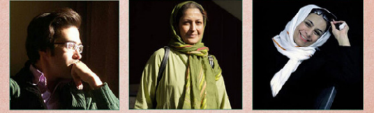
گروه داوران جشنواره تئاتر کودک و نوجوان