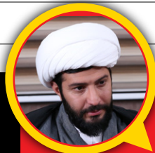
کیاوش زارع طلب نویسنده و بازیگر: