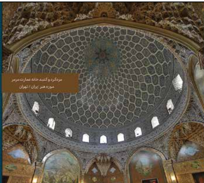
مژگرد و گنبد خانه عمارت نرگس موزه هنر ایران / تهران